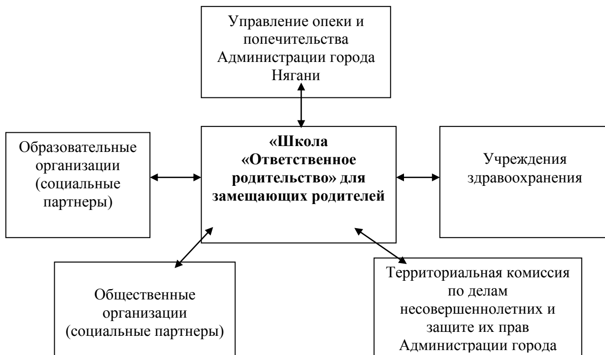
Схема 2. Межведомственное взаимодействие и социальное партнерство с учреждениями и организациями города.