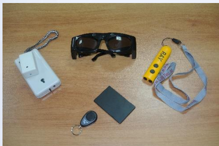
Говорящий маячок, ультразвуковые очки, электронная трость и др.

К тифлотехническим средствам, помогающим при пространственном ориентировании, относятся: