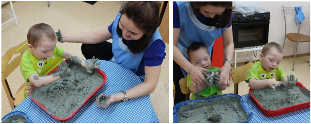
Рисунок 1. «Гонфельд-терапия»

Лепка из глины – является творческим и увлекательным занятием, так как материал очень пластичен и дает возможность изготавливать примерно те же изделия, что и из пластилина, но куда красивее! Тем более, если пластилин – материал для детей, то вот глина – «взрослая» субстанция, а значит, ребёнок творить будет с удовольствием, ведь незнакомые вещи неизменно манят детские умы. В процессе этих занятий у ребёнка развивается творческое воображение, фантазия, улучшается мелкая моторика рук. (Рис.2)