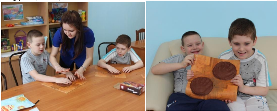
Рисунок 2. Изготовление слепка «Ладочки»

Лепка из глины – является творческим и увлекательным занятием, так как материал очень пластичен и дает возможность изготавливать примерно те же изделия, что и из пластилина, но куда красивее! Тем более, если пластилин – материал для детей, то вот глина – «взрослая» субстанция, а значит, ребёнок творить будет с удовольствием, ведь незнакомые вещи неизменно манят детские умы. В процессе этих занятий у ребёнка развивается творческое воображение, фантазия, улучшается мелкая моторика рук. (Рис.2)