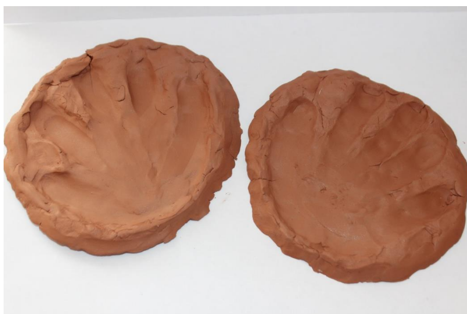
Рисунок 8. Лепка из глины