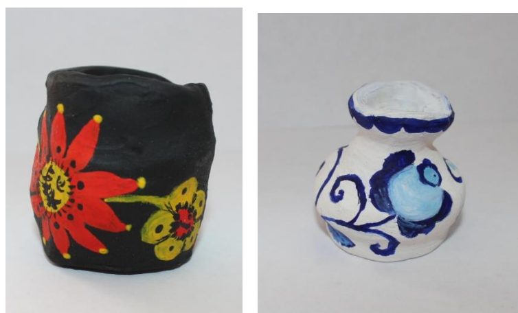
Рисунок 9. Расписные изделия