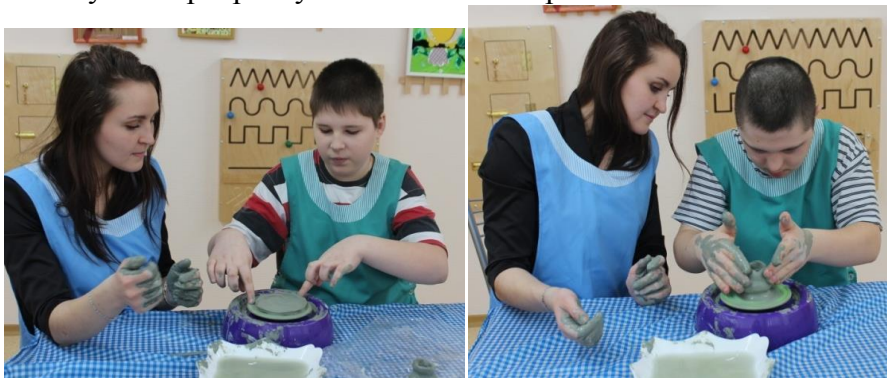
Рисунок 3. Изготовление глиняной посуды.

Гончарное ремесло это занятия, на которых дети не только постигают азы гончарного ремесла, но и развивают моторику (как мелкую, так и общую), концентрацию внимания, усидчивость, пространственное мышление, творческие способности. Мягкая глина и мерное вращение гончарного круга способны заворожить кого угодно, а на ребенка они производят поистине магическое воздействие. И это не удивительно, ведь что может быть чудеснее, чем превращение бесформенного, казалось бы, куска глины в прекрасную вазу, кувшин или чашу? В такие минуты ребенок чувствует себя настоящим волшебником, способным творить чудеса, а его фантазия получает прекрасную возможность проявить себя.