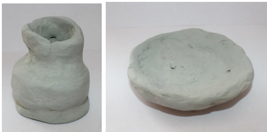
Рисунок 7. Глиняные изделия, сделанные на гончарном круге.