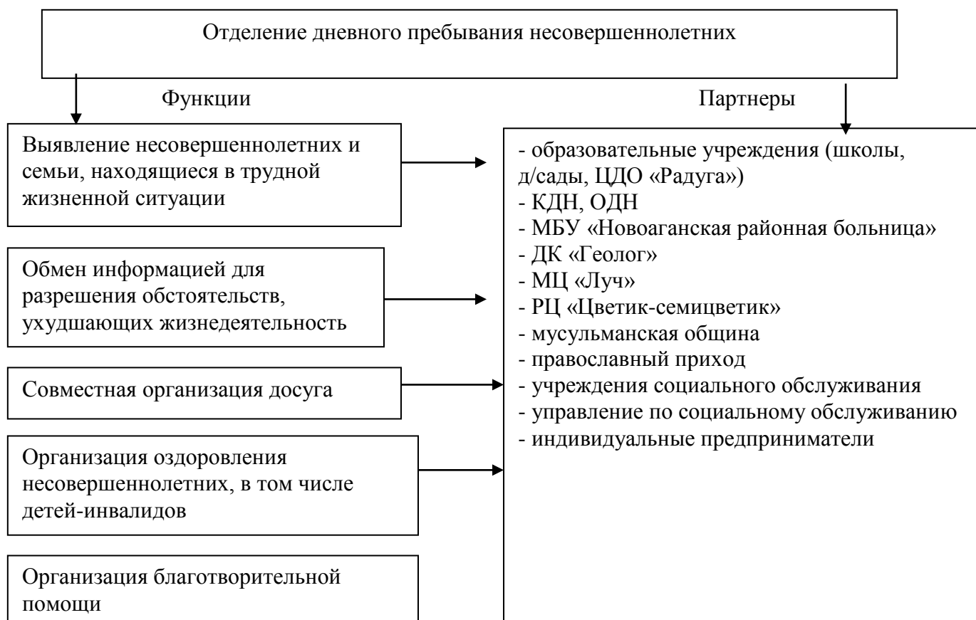
Схема взаимодействий с социальными партнерами