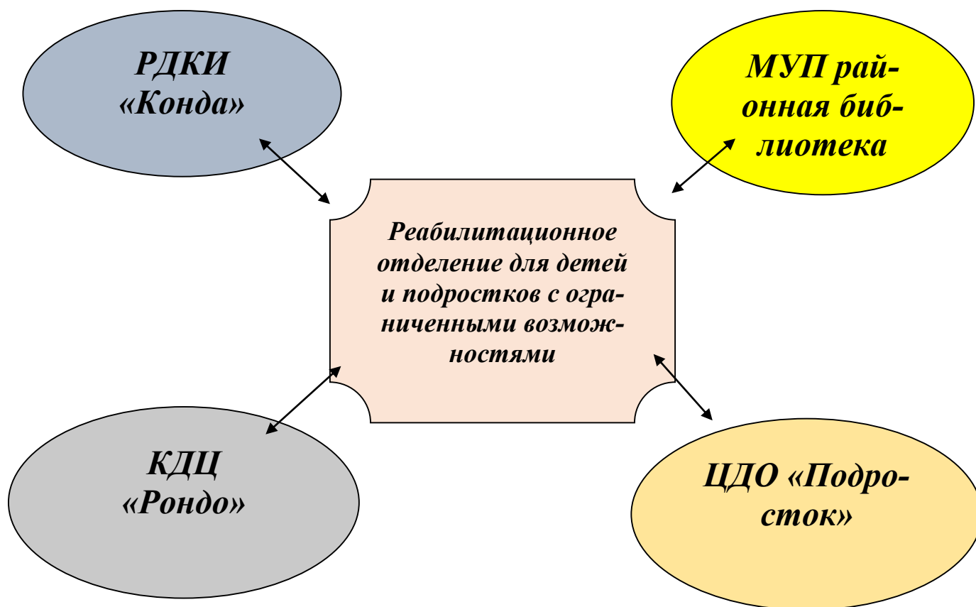
СХЕМА МЕЖВЕДОМСТВЕННОГО ВЗАИМОДЕЙСТВИЯ

Взаимодействие со специалистами РДКИ «Конда», МУП районная библиотека, КДЦ «Рондо», ЦДО «Подросток» будет производиться на основании соглашения с целью участия воспитанников реабилитационного отделения в мероприятиях анимационного характера, выставках и конкурсах детского творчества, и экскурсиях. Сведения о мероприятиях, проведенных в рамках межведомственного взаимодействия будут представлены в ежегодном аналитическом отчете.