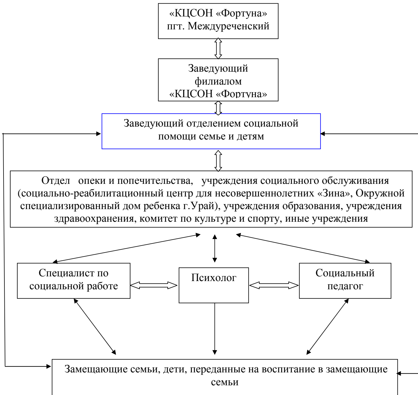
Схема межведомственного взаимодействия