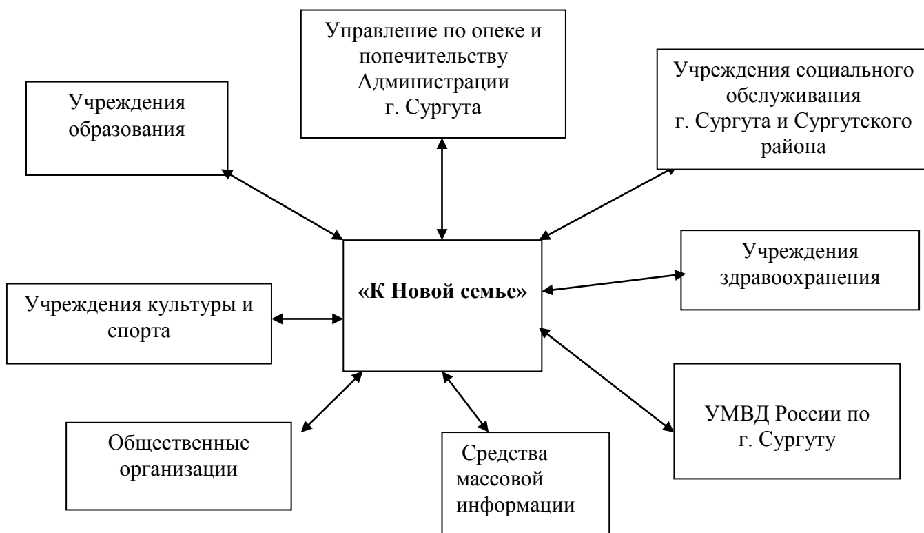
Схема межведомственного взаимодействия и социального партнерства с учреждениями и организациями города