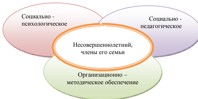
Рис 1. Содержание деятельности