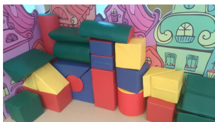
Мягкие игровые модули