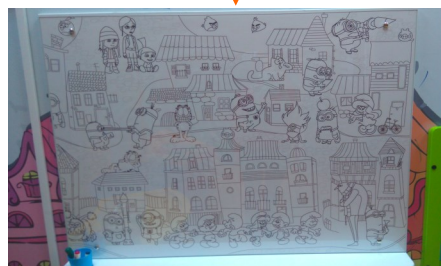
Панель для «позитивного» рисования