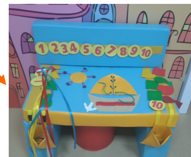
Игровой дидактический стол