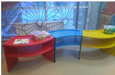
Многофункциональный стол «Ручеек»